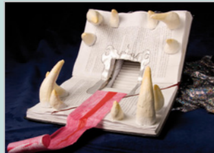
Laguntzailea/Colabora: Gasteiz On